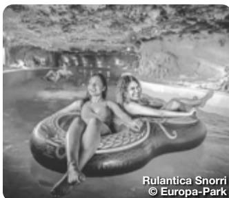
Rulantica Snorri