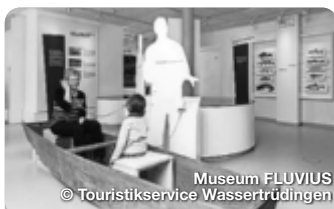
Museum FLUVIUS

Mit dem Naturpark Frankenhöhe im Norden, dem Hesselberg im Süden und vielen kleinen Dörfern, bestimmt eine weitläufige Natur das Bild der sanften Mittelgebirgslandschaft im Romantischen Franken. Das große historische Erbe zeigt sich in den ehemaligen Reichsstädten, den früheren Klöstern und in der Markgrafenresidenz Ansbach. Die Städte im Romantischen Franken sind Glanzpunkte deutscher Städtebaukunst. Beeindruckende Fachwerkhäuser, geschlossene Stadtmauern, verwinkelte Gassen, Tore und Türme aus dem Mittelalter bestimmen die Stadtbilder. Die berühmte alte Reichsstadt Rothenburg ob der Tauber thront hoch über dem Fluss und ist Romantik pur. TreffpunktDeutschland.de/romantisches-franken