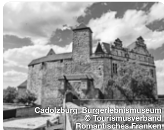
Cadolzburg Bürgerlebnismuseum

Alle Termine und Angaben unter Vorbehalt!