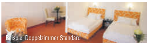
Beispiel Doppelzimmer Standard

Ihr Hotel ist knapp 3 km vom Ortskern entfernt. Es besteht aus zwei Gebäuden und bietet u. a. ein Restaurant, Terrasse und Aufzug. Die Poseidon-Therme (ca. 1.600 m 2 ) mit Außenpool, Thermalbecken, Whirlpool u. v. m. erreichen Sie bequem über einen Bademantelgang.